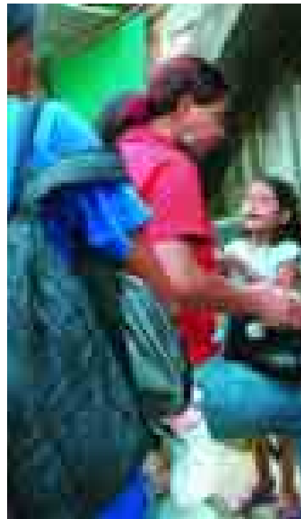
L-R: FIRST TWO PHOTOS - UNHCR/B. HEGER/DP/ECU-2004