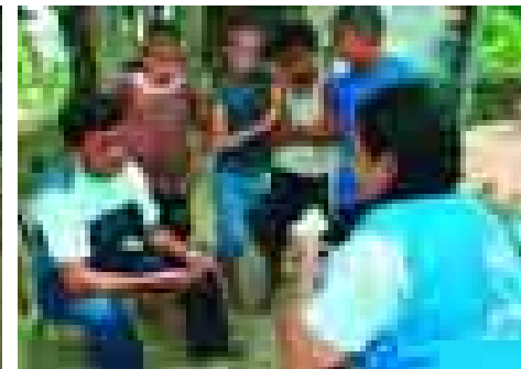
Hilfe für Neuankömmlinge in Venezuela.