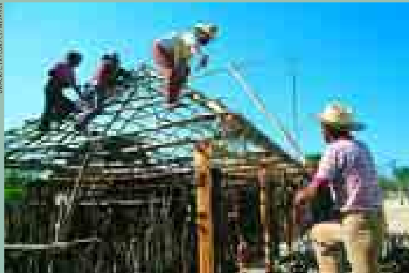
Guatemalteke Flüchtlinge bauen sich in Mexiko ein neues Heim.

vertrieben und mehrere Hunderttausend zogen in Nachbarländer.