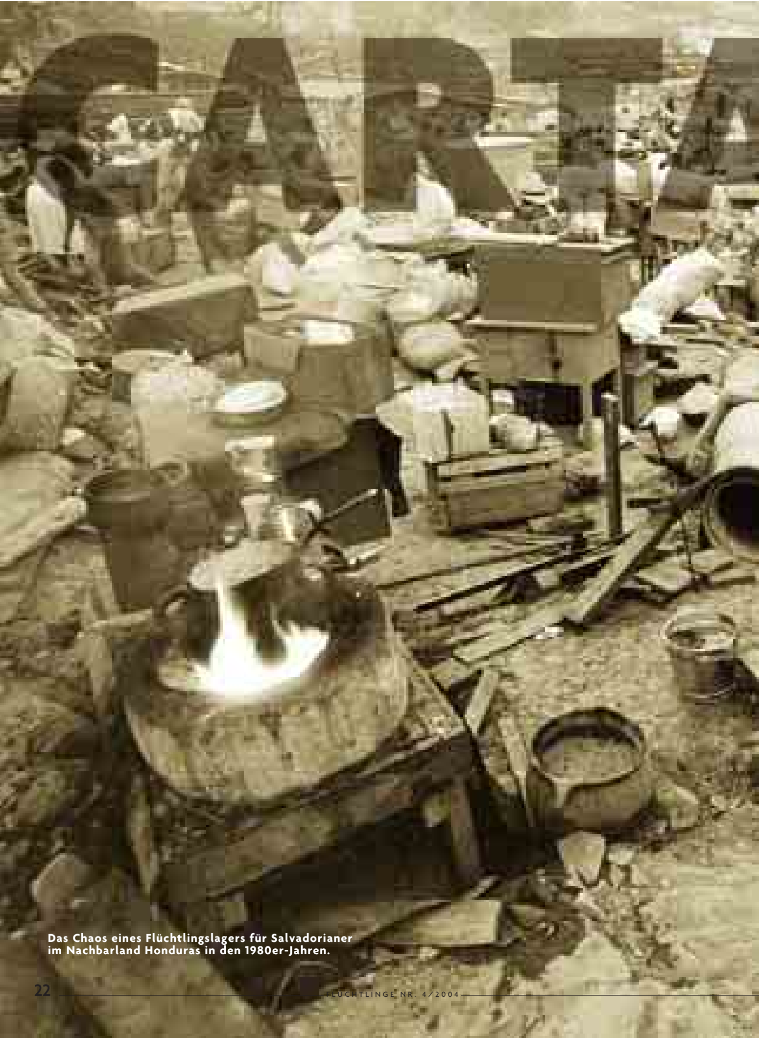
Das Chaos eines Flüchtlingslagers für Salvadorianer im Nachbarland Honduras in den 1980er-Jahren.