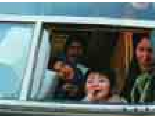
Rückkehr aus dem Iran.

Lubbers lobte die Initiative und sagte, es sei „ermutigend, wenn sich in einem weltweiten Klima restriktiver Asylpolitik und der Erosion von Schutzprinzipien Länder in Lateinamerika entschlossen zeigen, an hohen Schutzstandards festzuhalten“.