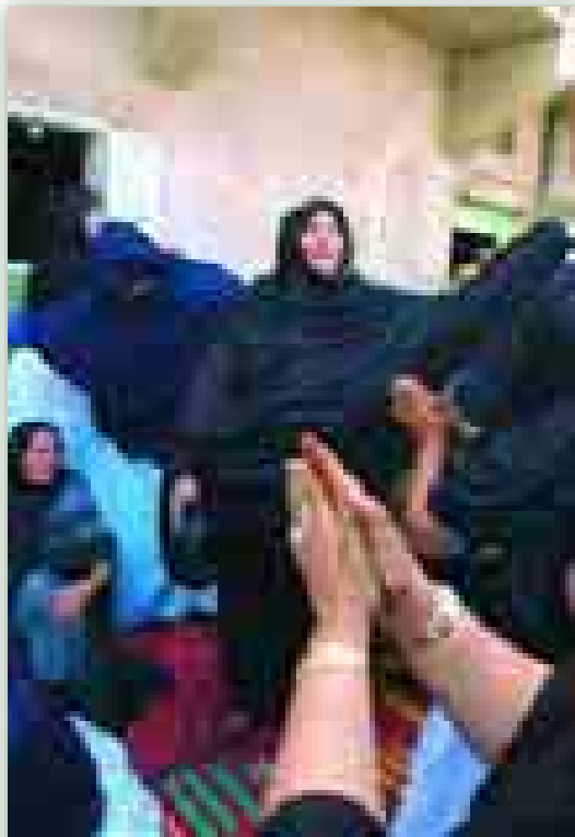
Verwandte und Freunde feiern zum ersten Mal seit Jahren ein Wiedersehen. Die Welt hat die Krise in der Westsahara fast vergessen.

„Eine Ausweitung der Einwanderung ist wahrscheinlich eines der notwendigen Elemente, um sicherzustellen, dass der Wohlstand in Europa in 45 Jahren ähnlich wie heute sein wird“, hieß es in dem Bericht. „Die vorhandenen Belege deuten darauf hin,