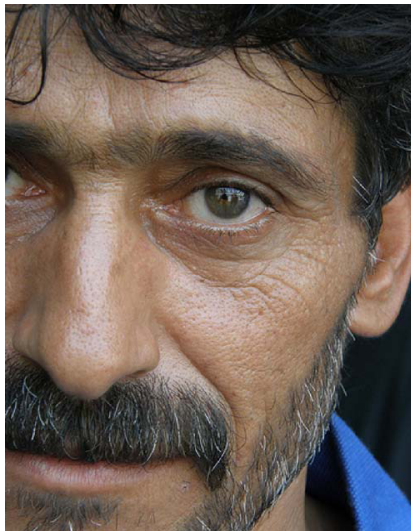
Portrait eines irakischen Flüchtlings

Resettlement verfolgt in der Türkei vor allem strategische Ziele, einschließlich der Verbesserung des Schutzsystems für nichteuropäische Flüchtlinge. Während UNHCR von der türkischen Regierung mittel- und langfristig konkrete Anstrengungen zur Verbesserung der Schutzstandards sowie zum Aufbau der für einen effektiven Schutz erforderlichen Infrastruktur erwartet, ist eine adäquate, kurzfristige Lösung der bestehenden Probleme beim Schutz außereuropäischer Flüchtlinge derzeit nicht absehbar. In vielen Fällen bleibt daher in den nächsten Jahren die dauerhafte Neuansiedlung aufgrund rechtlicher oder physischer Schutzbedürfnisse die einzige Lösung, wobei besonders verletzte Flüchtlinge mit spezifischen Schutzbedürfnissen – beispielsweise Frauen mit besonderer Risikoexposition, allein erziehende Mütter mit kleinen Kindern, Großfamilien, unbegleitete Minderjährige sowie Flüchtlinge mit akuten oder chronischen Erkrankungen - Priorität genießen.