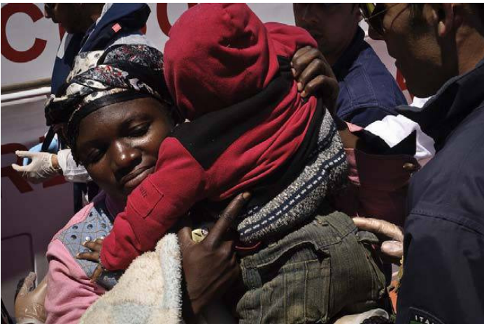
Rettung von Mutter und Kind bei einem Schiffsunfall im Mittelmeer, © UNHCR / F. Noy / Mai 2011

Libyen ist Vertragsstaat der OAU-Flüchtlingskonvention, hat jedoch die Genfer Flüchtlingskonvention ebenso wenig unterzeichnet wie das Protokoll von 1967 über die Rechtsstellung der Flüchtlinge. Ein nationales Asylsystem ist im Prinzip nicht existent und alle schutzbezogenen Aktivitäten einschließlich der Registrierung, der Statusfeststellung und der Bereitstellung von Hilfs- und Unterstützungsleistungen wurden deshalb ausschließlich von UNHCR wahrgenommen. In Ermangelung einer Vereinbarung über die Zusammenarbeit zwischen der libyschen Regierung und UNHCR, das die Präsenz und den operativen Rahmen der Tätigkeit von UNHCR verbindlich regeln könnte, blieb das Engagement von UNHCR zugunsten der in Libyen aufhältigen Flüchtlinge und Schutzsuchenden bisher jedoch begrenzt und unvorhersehbar. UNHCR hat sich deshalb bereits in der Vergangenheit für die Neuansiedlung der in Libyen unter Mandatsschutz gestellten Flüchtlinge im Wege des Resettlement eingesetzt. Der Konflikt in Libyen hat die Situation der dort registrierten Flüchtlinge und Schutzsuchenden jedoch nochmals dramatisch verschärft. Sie befinden sich sowohl in Libyen selbst als auch an den Grenzen zu den Nachbarstaaten in einer akuten Notsituation, können nicht dort bleiben, wo sie sind, aber auch nicht