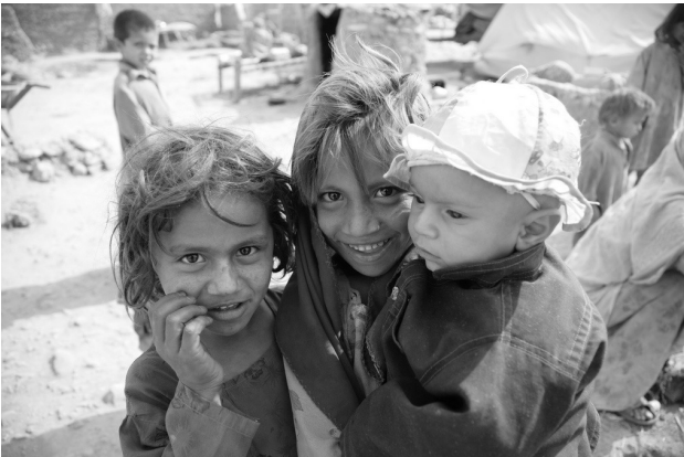
Afghanische Kinder, in Pakistan geboren.

Im Verlaufe der letzten 5 Jahre ist Resettlement in Pakistan nur in einzelnen Fällen als Instrument zur individuellen Verbesserung der Schutzsituation eingesetzt worden. Zwischen 2006 und 2010 wurden lediglich 530 Personen aus Pakistan in aufnahmebereiten Drittstaaten neu angesiedelt (2010 – 166 Personen, 2009 – 115 Personen, 2008 – 62 Personen, 2007– 64 Personen, 2006 – 123 Personen). Der tatsächliche Resettlement-Bedarf ist jedoch wesentlich größer. Die pakistanische Regierung hat wiederholt eine effektivere internationale Lastenteilung durch verstärkte Resettlement-