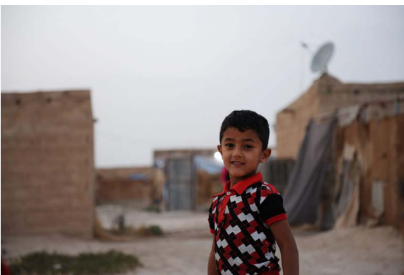
Irakischer Junge im Al Hol camp

Syrien, Jordanien und der Libanon haben in den vergangenen Jahren die Hauptlast der nach dem Sturz Saddam Husseins im März 2003 einsetzenden massiven Fluchtströme aus dem Irak getragen und irakischen Flüchtlingen großzügig Zuflucht und zumindest temporären Schutz vor Gewalt und Verfolgung in ihrem Heimatland geboten.