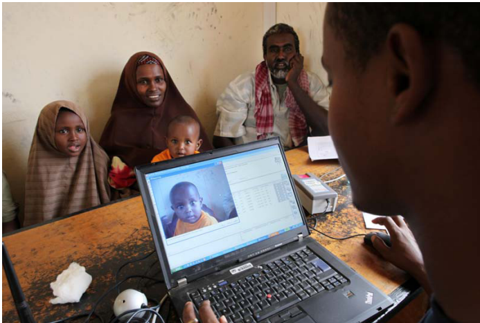
Registrierung einer somalischen Familie

UNHCR schätzt auf der Grundlage verfügbarer Daten zur Aufenthaltsdauer sowie verschiedener Vulnerabilitätsindikatoren der in Kenia lebenden Flüchtlinge, dass derzeit für insgesamt bis zu 139.000 Personen Bedarf an Resettlement besteht (Stand Juli 2011). Dieser Bedarf soll im Rahmen eines mehrjährigen Programms gedeckt werden. Dabei soll dem Resettlement somalischer sowie kongolesischer Flüchtlinge – insbesondere derjenigen mit langjährigem Aufenthalt in Kenia oder besonderen Bedürfnissen – Priorität eingeräumt werden, da diese Flüchtlinge aufgrund der fortdauernd instabilen Situation in der demokratischen Republik Kongo und in Somalia keinerlei Rückkehrperspektiven haben.