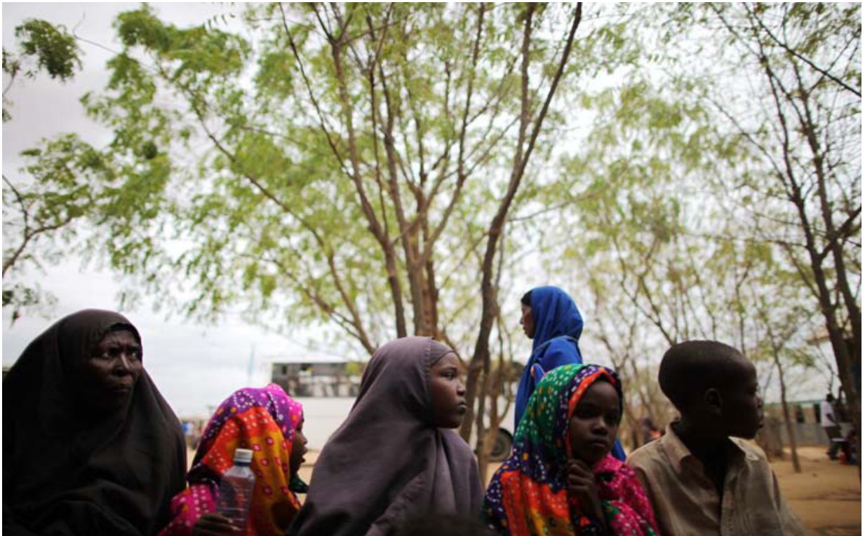
Somalis, Dadaab, Kenya.