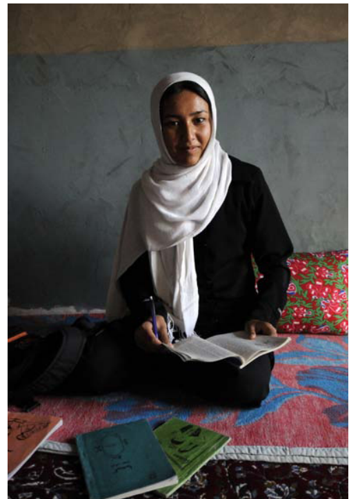
Afghanische Flüchtlingsfrau

Die begrenzte Zahl potentieller Aufnahmestaaten und damit das Fehlen einer ausreichend großen Zahl verfügbarer Resettlement-Plätze stellt derzeit das Hauptproblem für den effizienten strategischen Einsatz von Resettlement im Iran dar. Im Jahre 2010 wurden insgesamt nur 680 Flüchtlinge (143 Fälle) von den Resettlement-Staaten aufgenommen. Dies illustriert, wie begrenzt im Iran derzeit die Möglichkeiten für einen strategischen Einsatz von Resettlement im Vergleich zu anderen komplexen, lang anhaltenden Flüchtlingssituationen sind. Ein weiteres gravierendes Problem betrifft die von den Resettlement-Aufnahmestaaten gestellten Erwartungen an das Profil der für Resettlement vorgeschlagenen Fälle. So fokussierte sich in den vergangenen Jahren ein vordringliches Interesse verschiedener Resettlement-Aufnahmestaaten auf die Aufnahme von Frauen mit besonderer Risikoexposition. Wenngleich UNHCR das Engagement der Resettlement-Staaten für diese besonders verletzte Flüchtlingsgruppe schätzt, umfasst das Spektrum resettlementbedürftiger Fälle im Iran auch andere