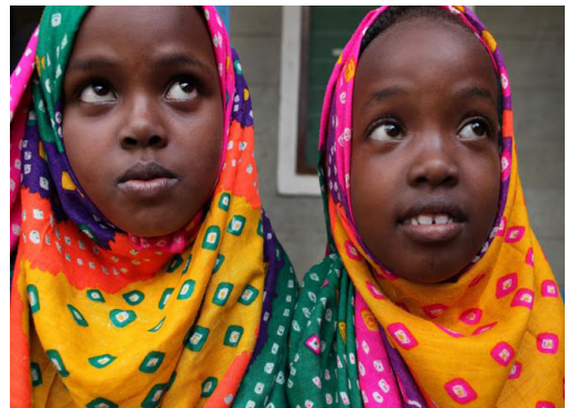
Flüchtlingsmädchen in Kenia.

Von der Umsetzung eines Mehrjahresprogramms zum Resettlement von bis zu 55.000 somalischen und äthiopischen Flüchtlingen somalischer Volkszugehörigkeit, die bereits in den Jahren 1991 und 1992 in Kenia Schutz gesucht haben, verspricht sich UNHCR überdies entscheidende Impulse, um den Zugang zu den in Dadaab lebenden Flüchtlingen zu verbessern und von den kenianischen Behörden mehr Land zur Entflechtung der angespannten räumlichen Situation zu erhalten. Dies setzt allerdings eine deutliche Steigerung der von potentiellen Resettlement-Staaten bereitgestellten Aufnahmeplätze insbesondere für somalische Flüchtlinge voraus. Der Schaffung zusätzlicher Aufnahmeplätze für somalische Flüchtlinge aus Kenia wird deshalb von der internationalen Arbeitsgruppe für Resettlement hohe Priorität eingeräumt.