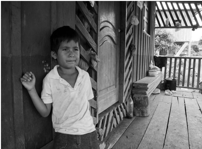
Kolumbianischer Flüchtlingsjunge

Obwohl die kolumbianische Regierung bedeutende Anstrengungen zur Verbesserung des Umgangs mit intern Vertriebenen unternommen hat, lässt die derzeitige Situation eine baldige Rückkehrmöglichkeit für kolumbianische Binnenvertriebene und Flüchtlinge nicht erwarten.